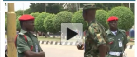
El Ejército nigeriano asegura tener localizadas a las niñas retenidas