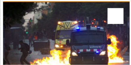
Violentos incidentes tras el desalojo de Can Vies